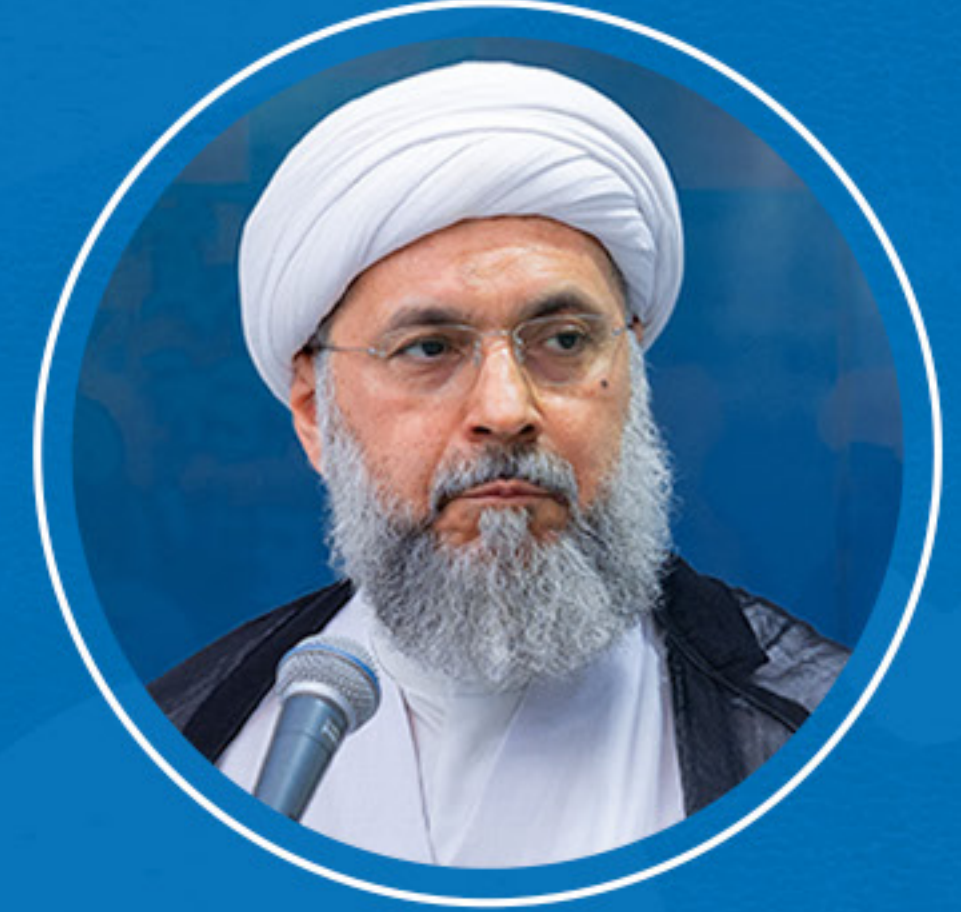
سماحة الشيخ عبدالله دشتي