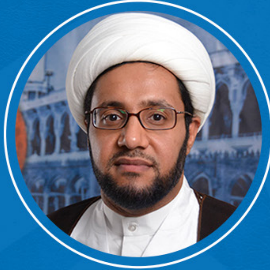
سماحة الشيخ علي العبود