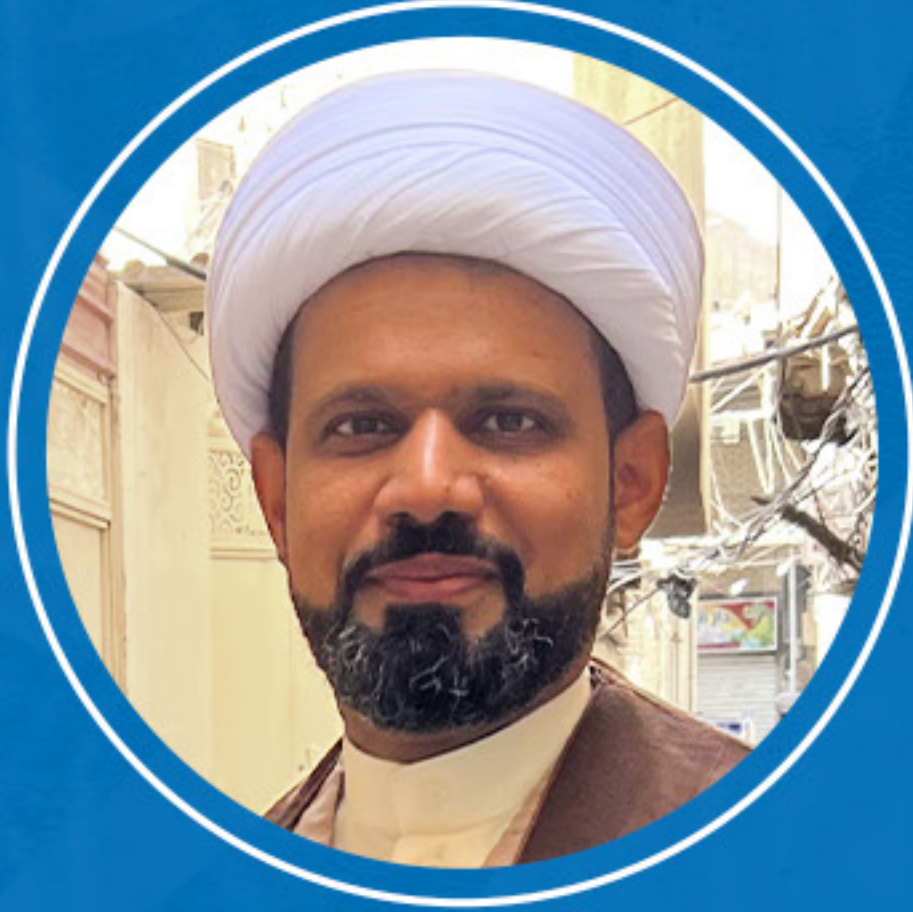
سماحة الشيخ أحمد الفرحان